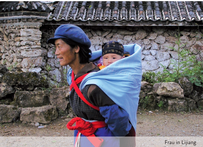
Frau in Lijiang